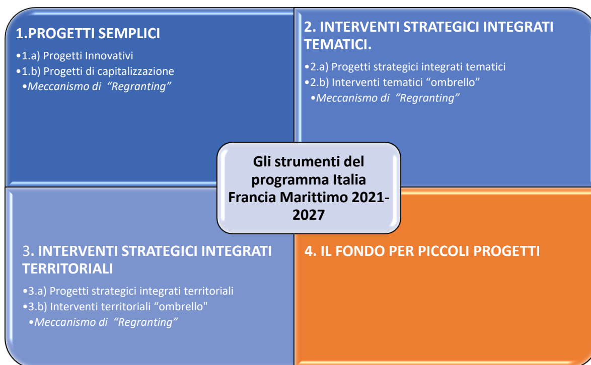
Tabella 2 - Gli strumenti 2021-27

La tabella che segue sintetizza le proposte di strumenti per la programmazione 2021-27.