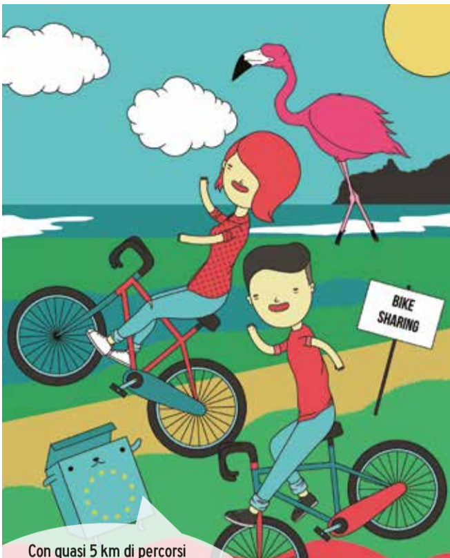
RIQUALIFICAZIONE VIABILITÀ CICLABILE NEL PARCO DI MOLENTARGIUS E STAZIONI DI BIKE SHARING. CAGLIARI

Con quasi 5 km di percorsi ciclabili, grazie al recupero ambientale e la riqualificazione della viabilità, il parco di Molentargius è un luogo ancora più magico. Perché la bicicletta ti fa scoprire meglio le meraviglie dell'area umida di Cagliari. Con il POR FESR Sardegna ci muoviamo verso il futuro.