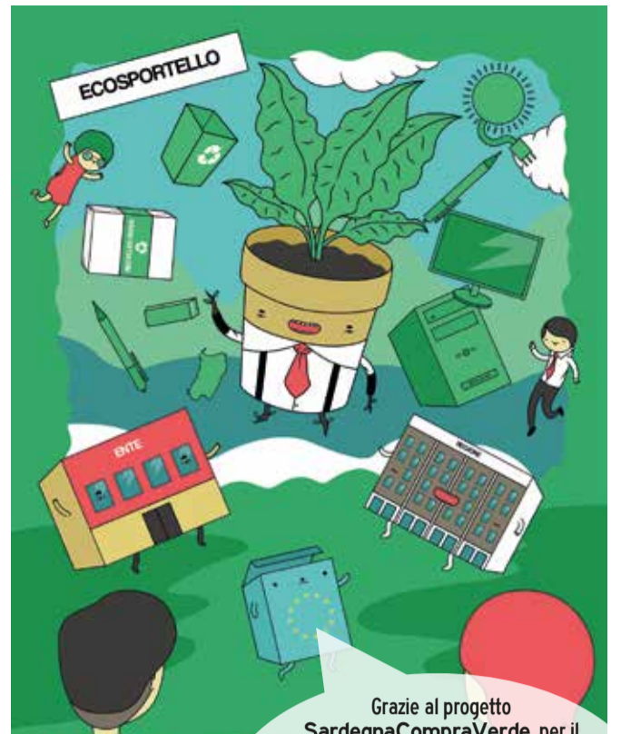
ECOSPORTELLI GREEN PUBLIC PROCUREMENT (GPP) PER GLI ACQUISTI VERDI

Grazie al progetto SardegnaCompraVerde, per il rispetto dell'ambiente e gli interventi a favore del consumo responsabile, nascono gli Ecosportelli Green Public Procurement che offrono assistenza e informazioni sugli acquisti pubblici ecologici. Con il POR FESR Sardegna l'ambiente è protagonista.