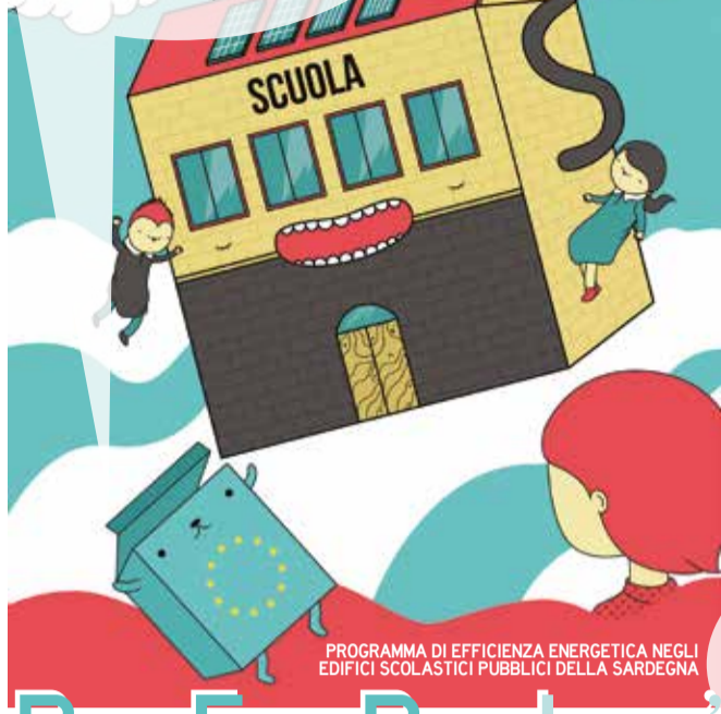
PROGRAMMA DI EFFICIENZA ENERGETICA NEGLI EDIFICI SCOLASTICI PUBBLICI DELLA SARDEGNA

Partiamo dalle scuole per migliorare il nostro futuro. Attraverso gli interventi di risparmio ed efficienza energetica, ogni anno si eviterà l'emissione in atmosfera di 215 tonnellate di CO2. Perché il bene più grande è l'ambiente in cui viviamo. Con il POR FESR Sardegna la nostra isola è più verde.