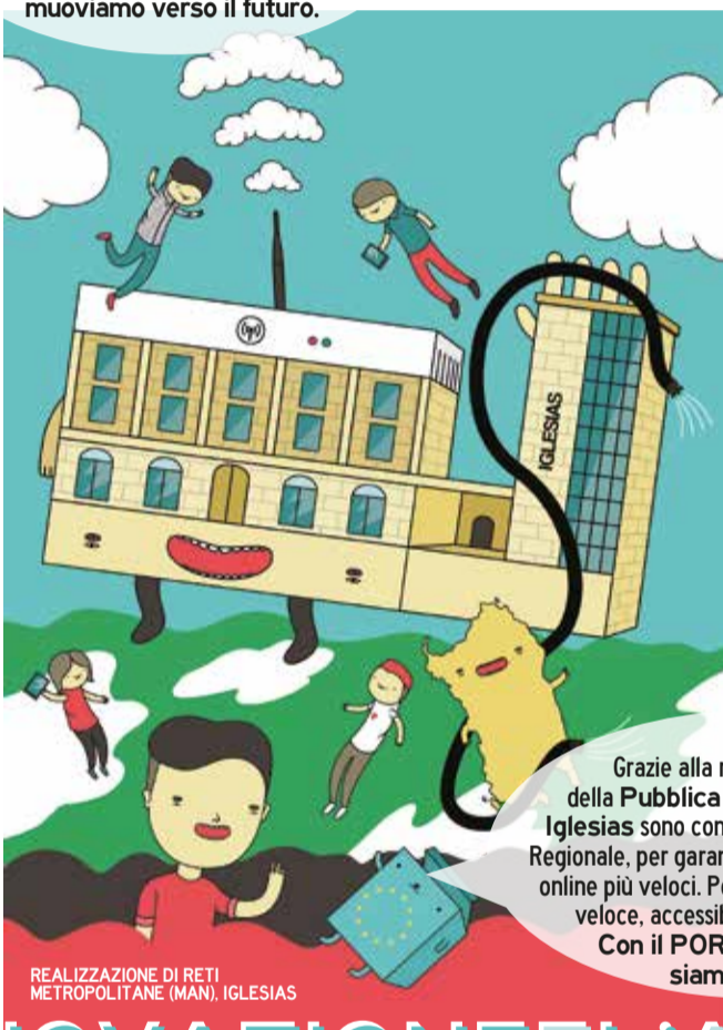
REALIZZAZIONE DI RETI METROPOLITANE (MAN), IGLESIAS

Grazie alla rete MAN gli uffici della Pubblica Amministrazione di Iglesias sono connessi alla Rete Telematica Regionale, per garantire alla cittadinanza servizi online più veloci. Per una Amministrazione più veloce, accessibile e vicina ai cittadini. Con il POR FESR Sardegna siamo più vicini.